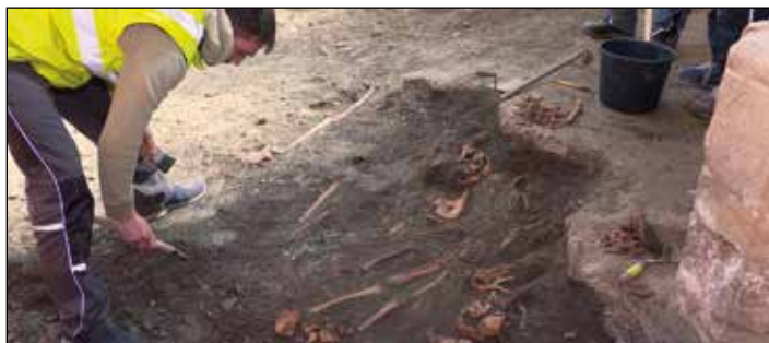
Interessante Funde der Archäologen: Jahrhunderte alte Skelette im Altarraum.