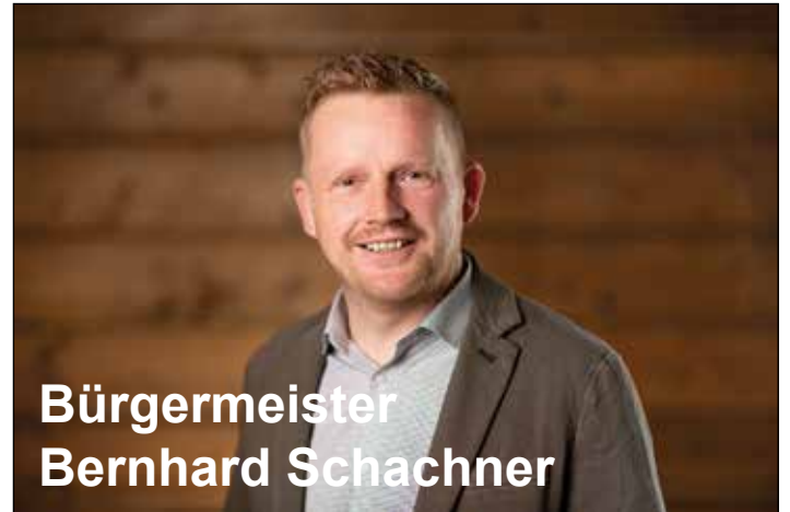
Bürgermeister Bernhard Schachner

Die Gesamtkosten der Sanierung belaufen sich auf ca. Euro 300.000,00. Auch wenn die Schlussrechnungen noch nicht zur Gänze vorliegen, so darf doch gesagt werden, dass die Kosten eingehalten werden können.