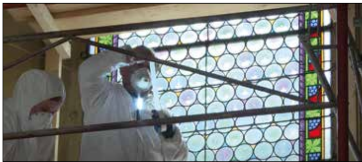
Die zum Großteil aus dem Historismus stammenden Kirchenfenster werden in der Werkstätte der Fa. Derix aufwändig restauriert.