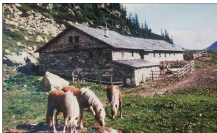
Die Hiekor Alpe ist ein Juwel der Hohen Tauern!