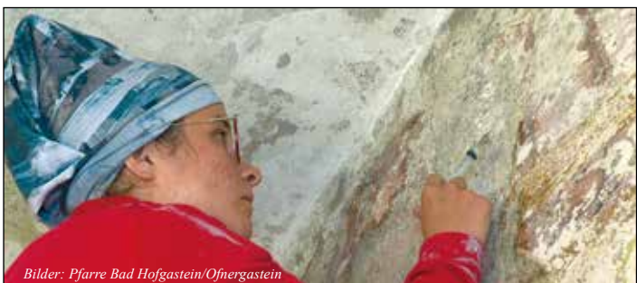
Die Restauratorin bei der Befundung und Sicherung alter Wandfresken in der „Geißlerkapelle“.

An dieser Stelle möchten wir im Namen der Pfarre für die bereits geleisteten Spenden sehr herzlich danken. Wir schätzen und freuen uns über jeden Euro, der uns hier weiterhilft.