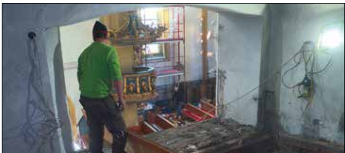
Das ehemalige „Oratorium“ der geistlichen Schwestern wurde zugemauert und die „Geißlerkapelle“ als Technikraum adaptiert.