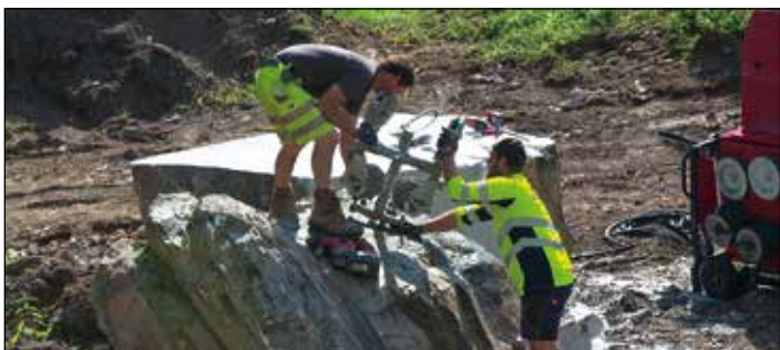
Ein weißer Marmorblock aus dem Zittrauersteinbruch wurde für die Bodenplatten in der Kirche zugeschnitten.