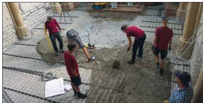
Die Boden- und Wandheizungen werden verlegt.